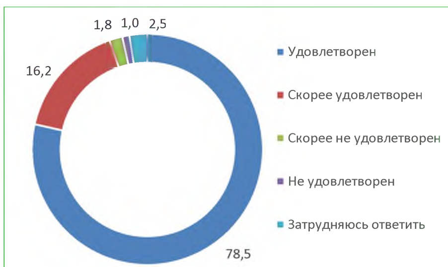
Диаграмма 7. Распределение ответов респондентов на вопрос «Удовлетворены ли Вы организационными условиями предоставления услуг (графиком работы организации, навигацией внутри организации)?», %

При ответе на вопрос «Удовлетворены ли Вы организационными условиями предоставления услуг (графиком работы организации, навигацией внутри организации)?», 94,7% респондентов ответили, что удовлетворены. Расчетный балл по показателю – 94,7.