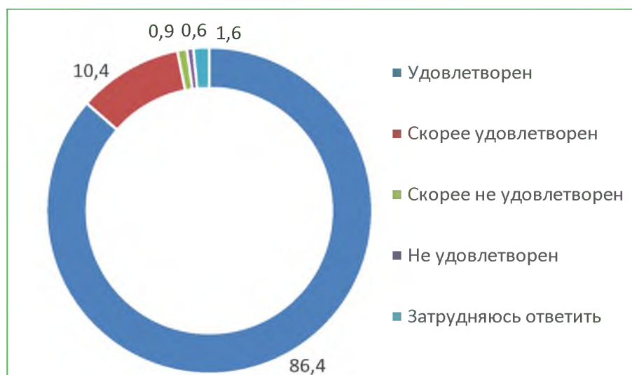
Диаграмма 6. Распределение ответов респондентов на вопрос «Удовлетворены ли Вы доброжелательностью и вежливостью работников организации, с которыми взаимодействовали в дистанционной форме?», %

Итого, по критерию «Доброжелательность, вежливость работников организации» расчетный показатель составил 95,8 балла.