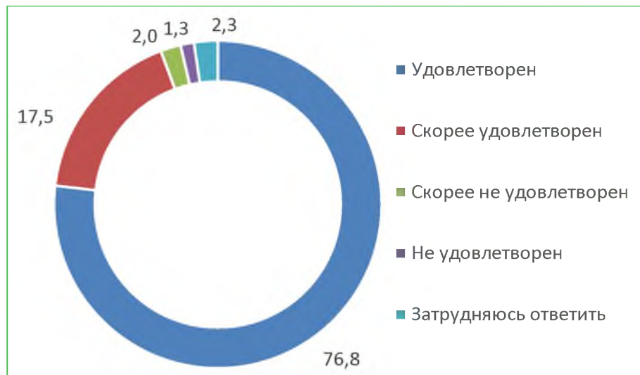
Диаграмма 4. Распределение ответов респондентов на вопрос «Удовлетворены ли Вы доброжелательностью и вежливостью работников организации, обеспечивающих первичный контакт с посетителями и информирование об услугах при непосредственном обращении в организацию?», %

При ответе на вопрос: «Удовлетворены ли Вы доброжелательностью работников организации, обеспечивающих непосредственное оказание услуги при обращении в организацию?», 96,7% респондентов удовлетворены. Расчетный балл по показателю – 96,7.